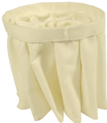
FI.0058.0000 – ФИЛЬТР ИЗ ПОЛИЭСТЕРА 14 КАРМАНОВ Ø500 (ФИЛЬТР класса М (С)—1 мкм)